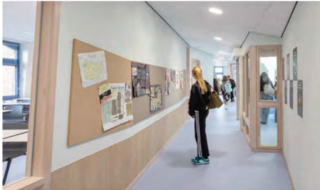
FOTO ONDER Zelfs de vorm van de prikboards sluit aan bij de karakteristieke architectuur van het gebouw.

spaces, de overloopgebieden van de lokalen rondom de lichte trappenhuisen.” In de secondary shared spaces werken de leerlingen samen of doen voorbereidend werk. De primary leerlingen (groep 1 tot en met 8) gaan naar kunstateliers, ze ontdekken en bouwen, verkleeden zich, bakken en eten in de keuken en werken aan hun taal- en rekenvaardigheid. Deze verschillende activiteiten worden ondersteund door de vormgeving en materialisering van het interieur. Mommersteeg: “Waar ‘gewerkt wordt’ heb ik meer rechte vormen toegepast; op de plekken waar de leerlingen ontspannen, zie je meer zachte vormen en materialen”.