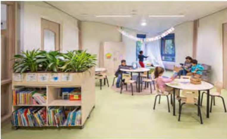
FOTO BOVEN Shared space van groep 1 met maatwerk garderobemeubel, bewust niet verrijdbaar uitgevoerd om definitie aan de ruimte te geven.

FOTO MIDDEN studiomommersteeg ontwierp naast meubilair ook vloerkleden en plantenbakken, deels geplaatst op bestaande verrijdbare kasten.