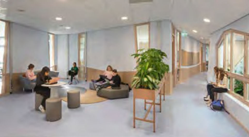
FOTO LINKSBOVEN Er is speciale aandacht besteed aan de zogenaamde shared spaces, de overloopgebieden van de lokalen rondom de lichte trappenhuizen.